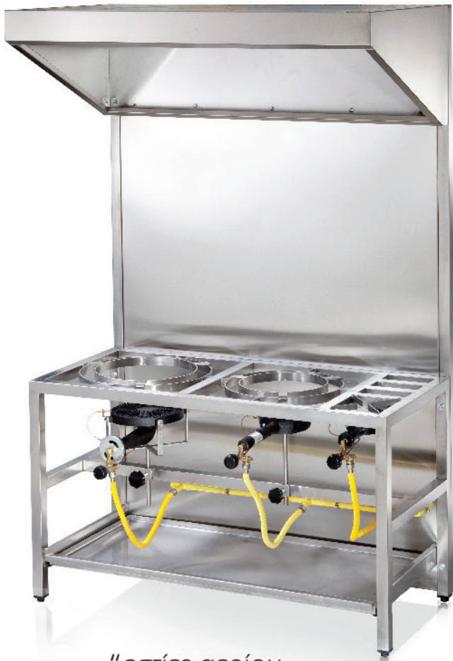
“εστίες αερίου διαφόρων διαστάσεων.”